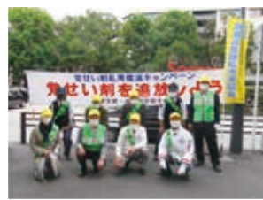
令和3年10月19日「浦和駅」