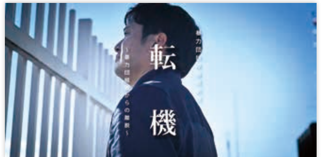
（埼玉弁護士会民事介入暴力対策委員会監修、捜査第四課製作の「暴力団組織からの離脱」啓発動画） 埼玉県警公式チャンネル（YouTube）

指定暴力団員が、脱退を希望している者に対し、「けじめをつけなきゃ。やめられるわけないだろ。辞めたり、逃げたりしたらこの辺りに家族もいさせない。」等と告げ、暴力団組織から脱退することを妨害した。