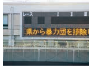
大宮競輪場 (埼玉県営競技事務所)