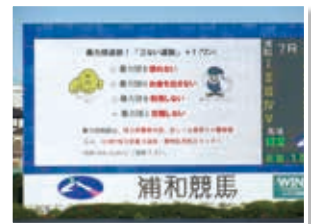
浦和競馬場 (埼玉県浦和競馬組合)