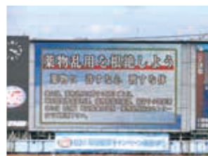
戸田競艇場 (戸田競艇企業団)