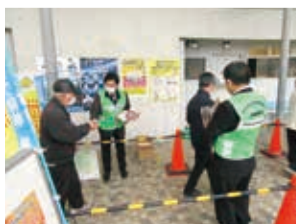
令和3年11月18日「西武園競輪場」