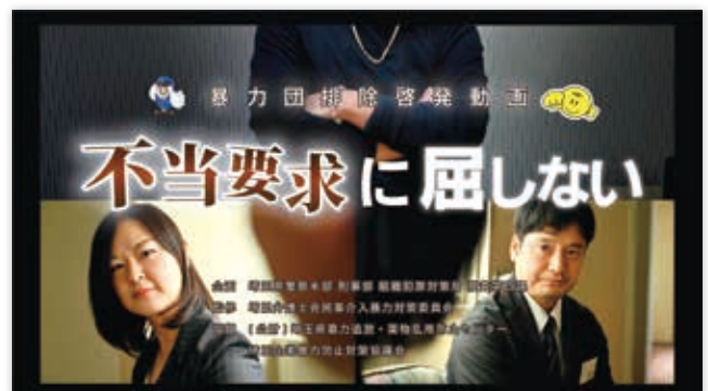
〈埼玉弁護士会民事介入暴力対策委員会監修、捜査第四課製作の「不当要求対応要領」動画〉 埼玉県警公式チャンネル (YouTube)

暴力団排除活動をより一層推進するために、暴力団排除キャンペーンや各種広報啓発活動を実施し、県民の暴力団排除意識の高揚を図っています。