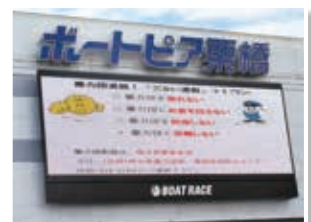
ボートピア栗橋 (埼玉県都市競艇)