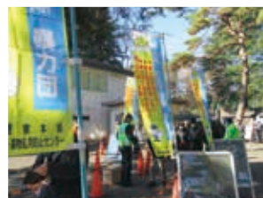
令和3年12月28日「大宮競輪場」