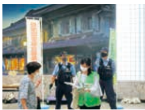
令和3年8月18日「川越駅」