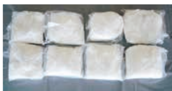
小分けされた覚醒剤