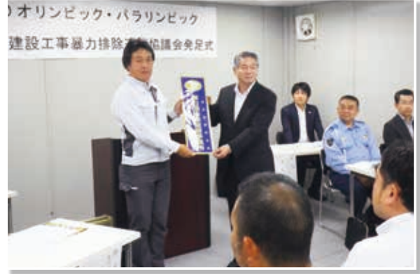
(令和元年9月27日 陸上自衛隊朝霞訓練場)