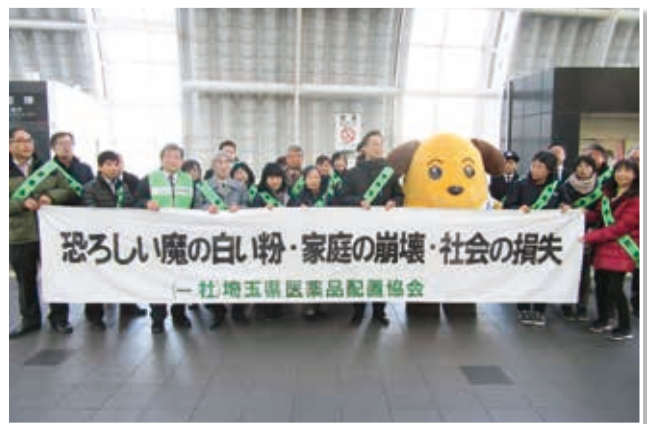
(令和2年1月13日 JRさいたま新都心駅)