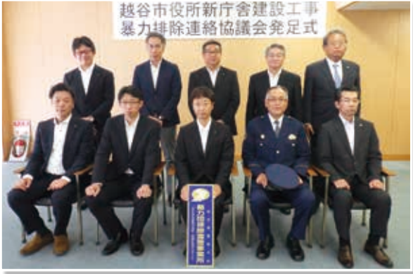
(令和元年10月4日 越谷市役所)