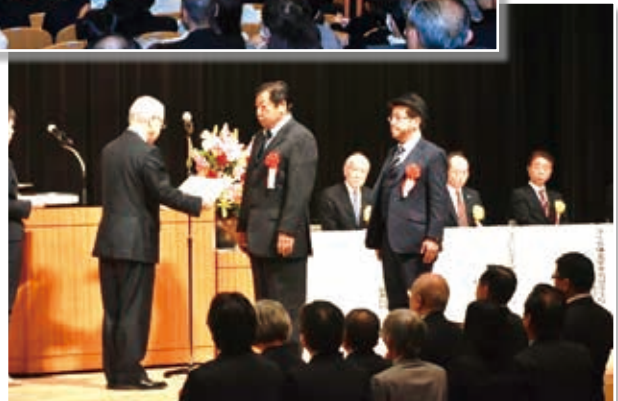
(令和2年1月30日 埼玉会館)