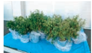
栽培された大麻草▲