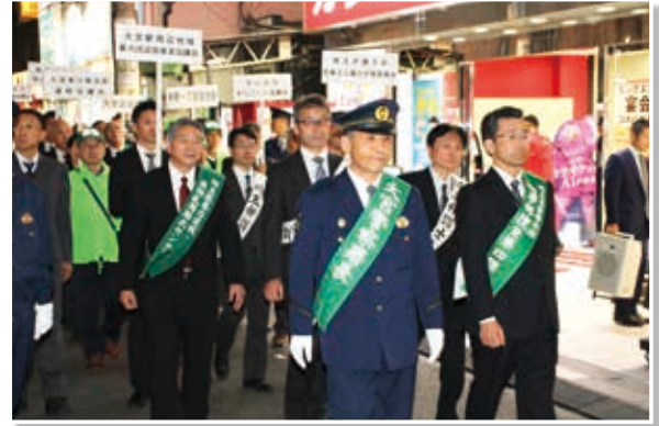
(令和元年11月6日 JR大宮駅・大宮南銀座地区)