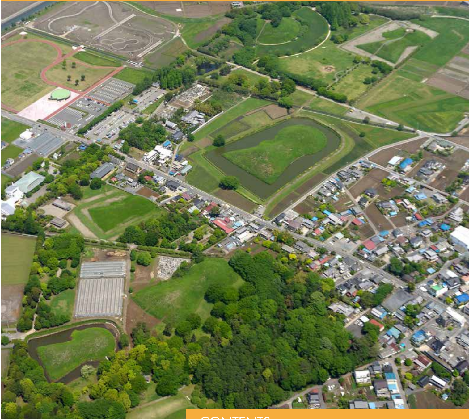
埼玉古墳群（行田市）