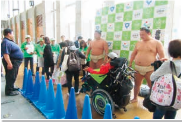
(平成31年4月25日 日高市文化体育館)