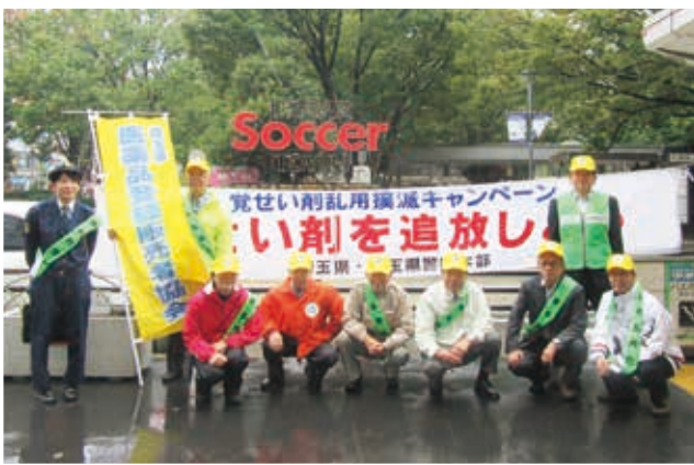
(令和元年10月22日 JR浦和駅)